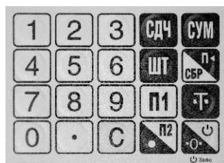
Рис. 3. Клавиатура