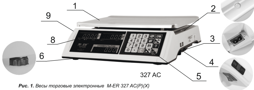
Рис. 1. Весы торговые электронные M-ER 327 AC(P)(X)